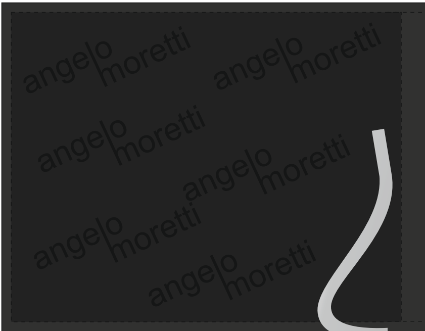
Внутренняя сторона слева