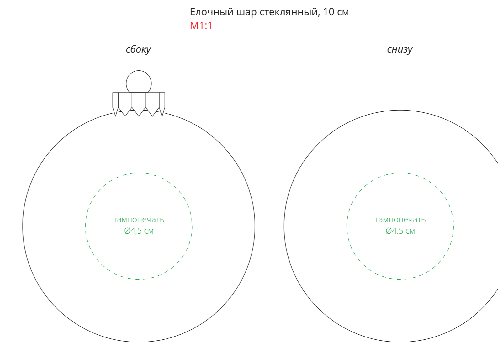
Елочный шар стеклянный, 10 см M1:1