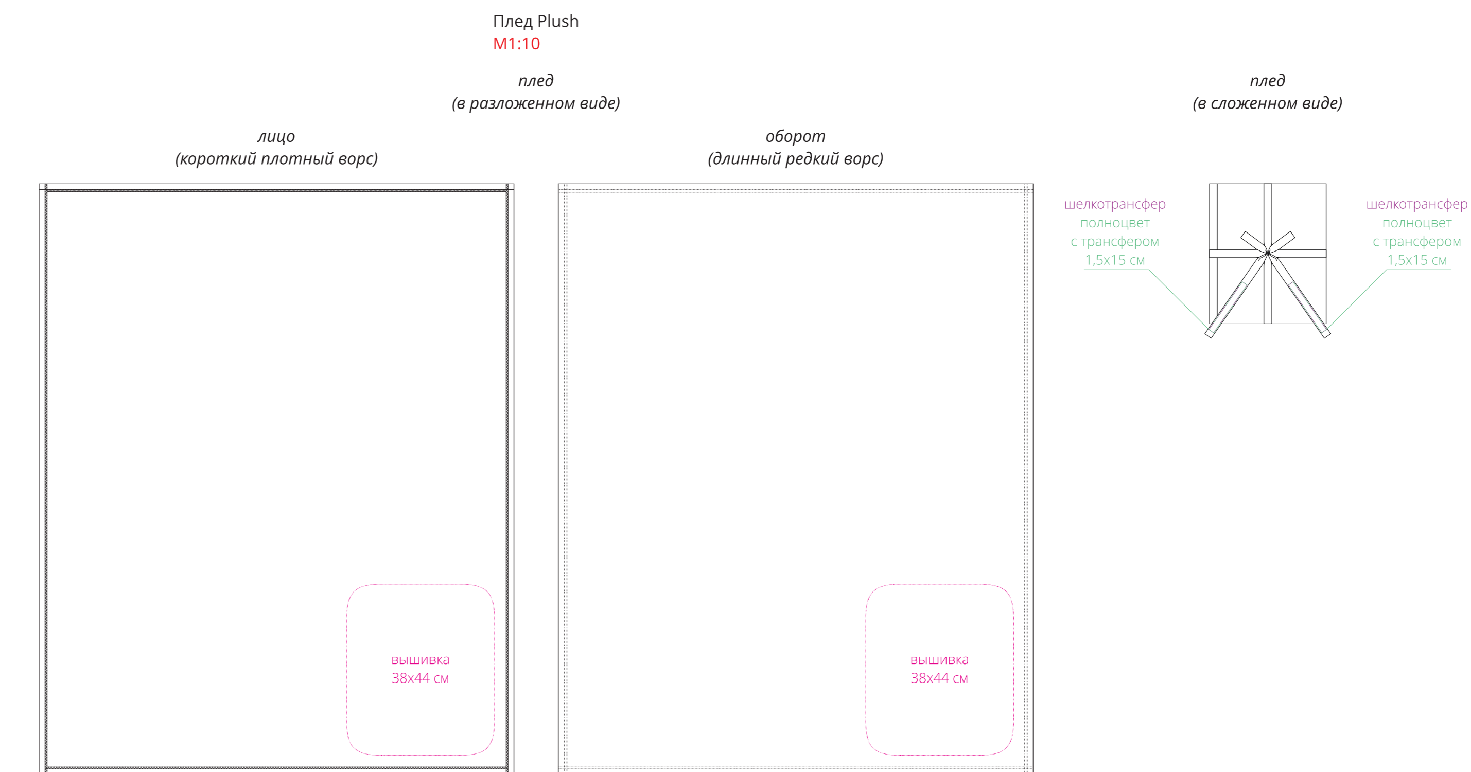
Плед Plush M1:10

Важно! Для гравировки по дереву - цвет нанесения на дереве обусловлен текстурой природного материала и может быть неоднородным!