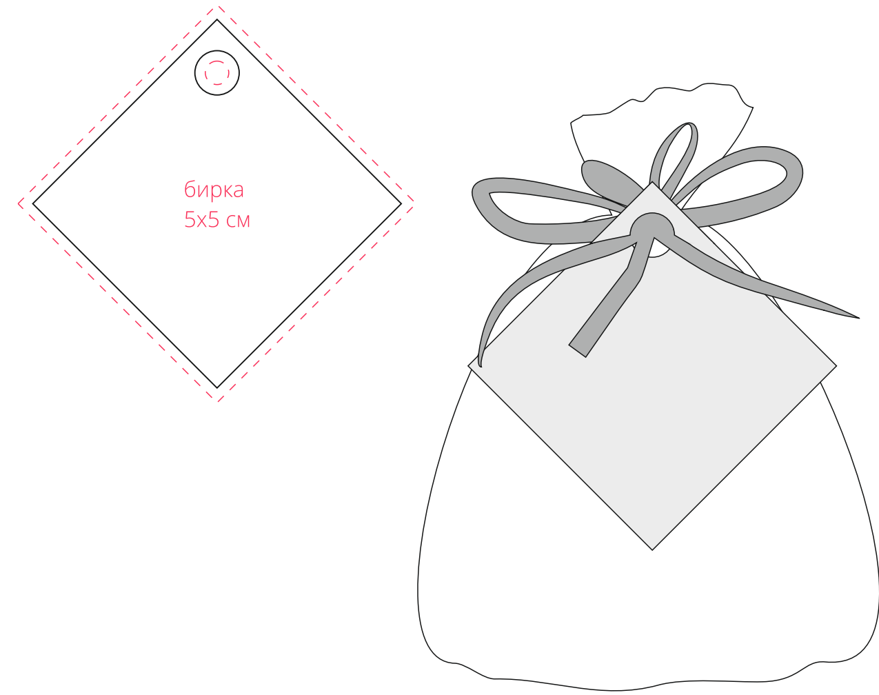
Специи для глнтвейна Winter Joy