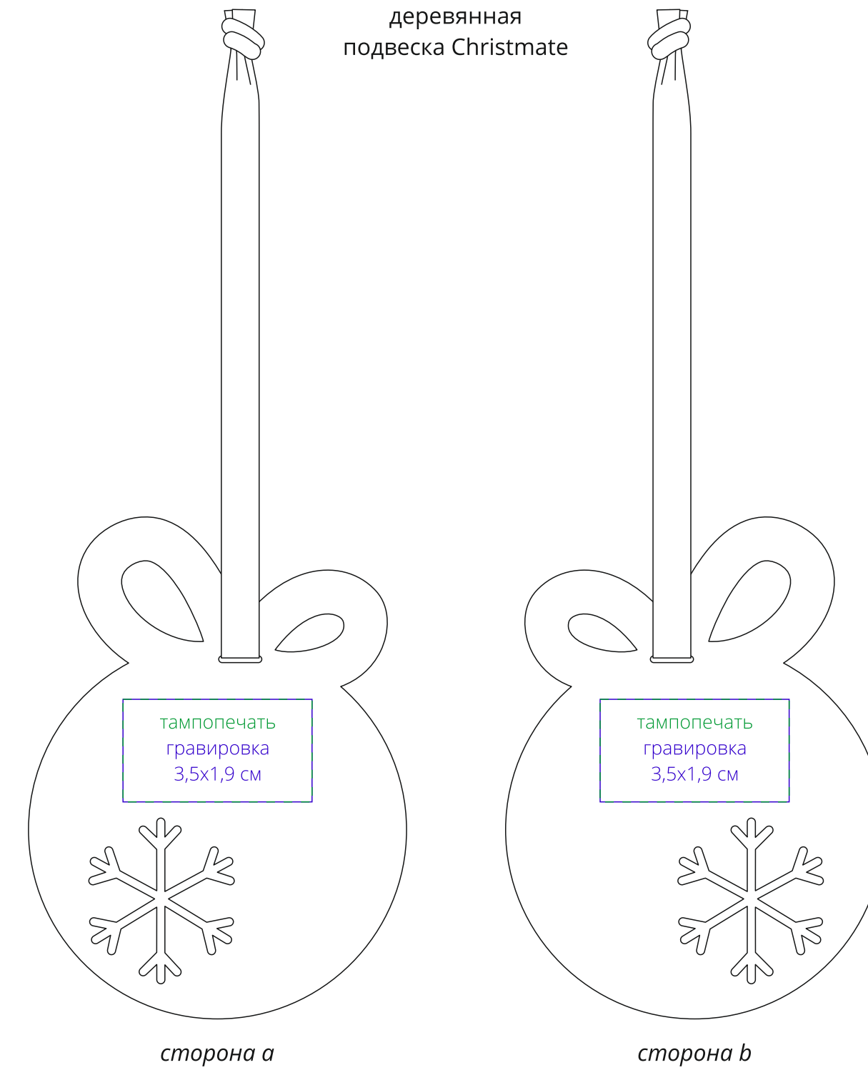
деревянная подвеска Christmate